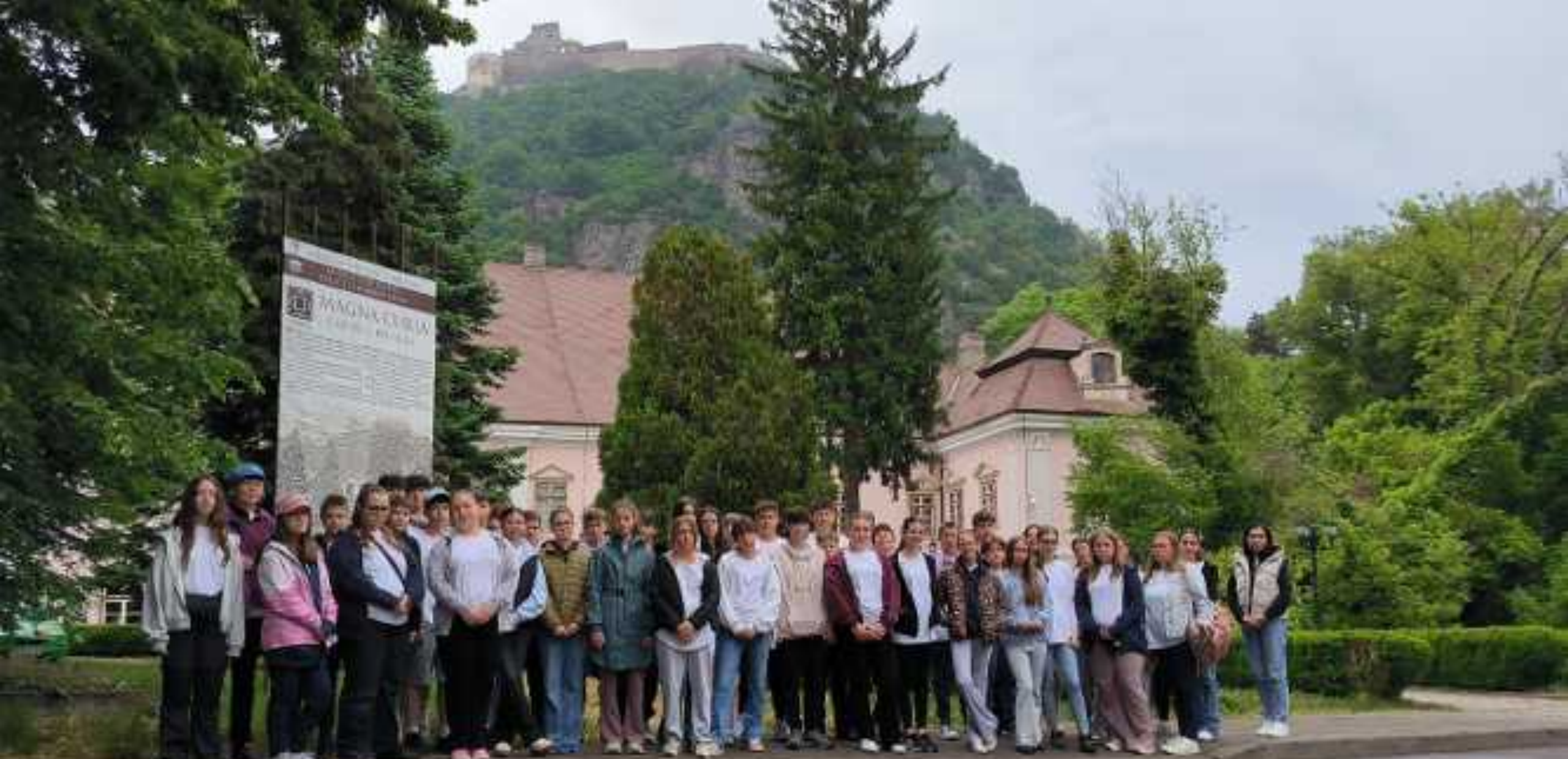
Így elsétáltunk a Magna Curia épületéig, ahol a várral a háttérben a Kőműves Kelemenné népballadát elevenítettük fel.