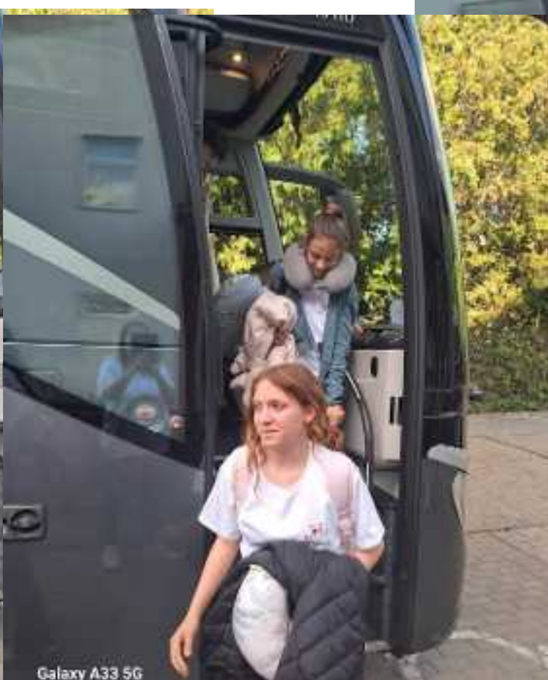
Galaxy A33 5G 2026. mājus 09. dū. 5:35