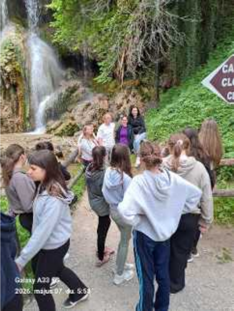
Galaxy A33 5G 2026. május 07. da. 5:53

Tudtuk , hogy az algyógyi vízesésben gyönyörködünk Erdélyben.