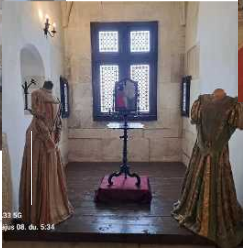
33 5G ejus 08. di. 5:34