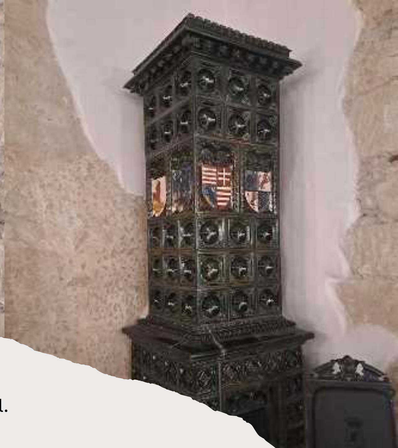
A címeres kályhánál is időztünk a Morzsinai és Hunyadi családról szóló érdekességekkel.