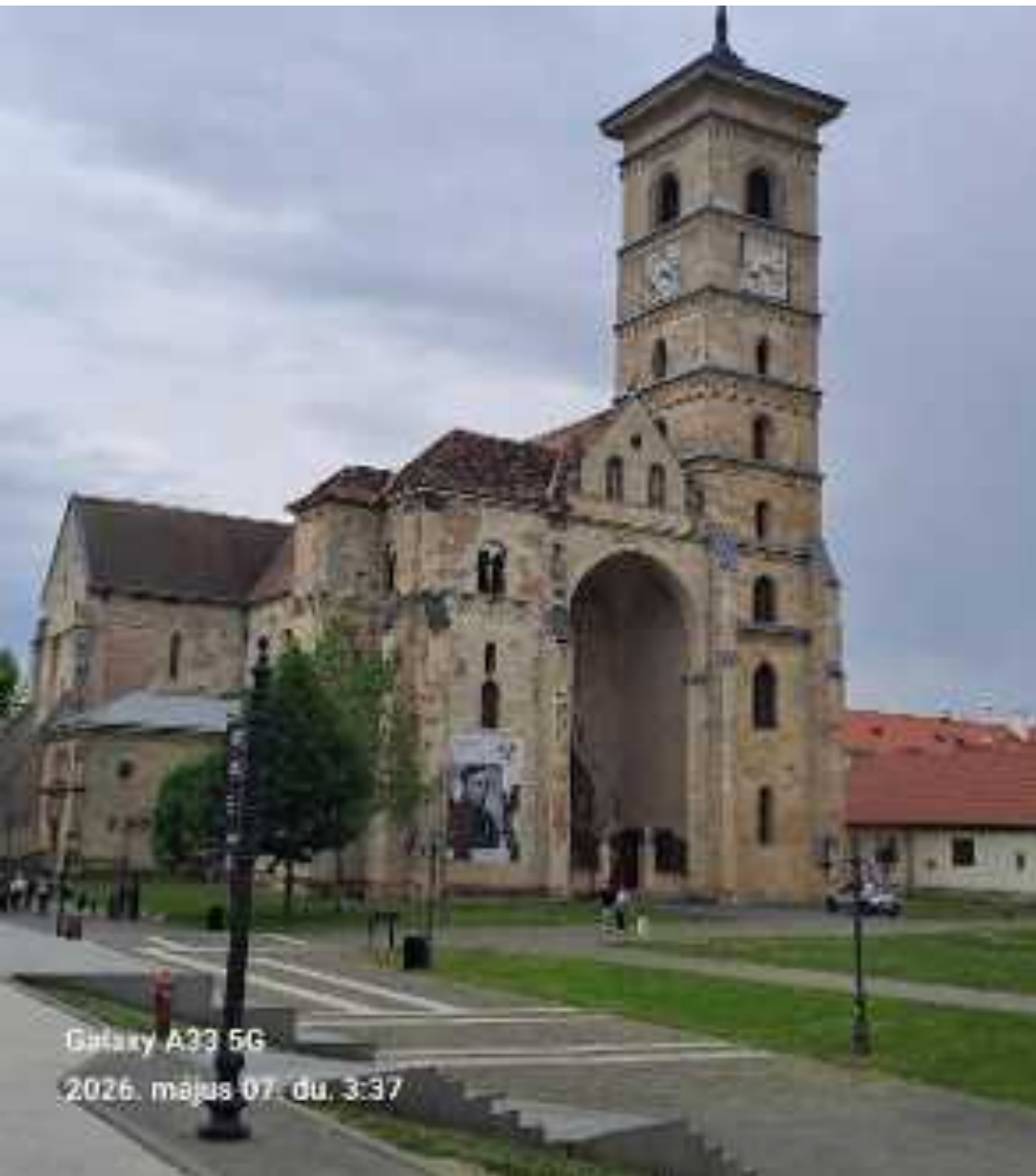
Szent Mihály székesegyház