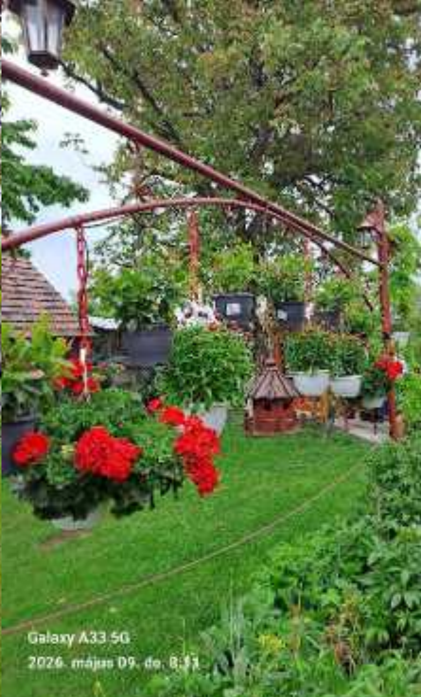
Galaxy A33 5G 2026. május 09. de. 8:33