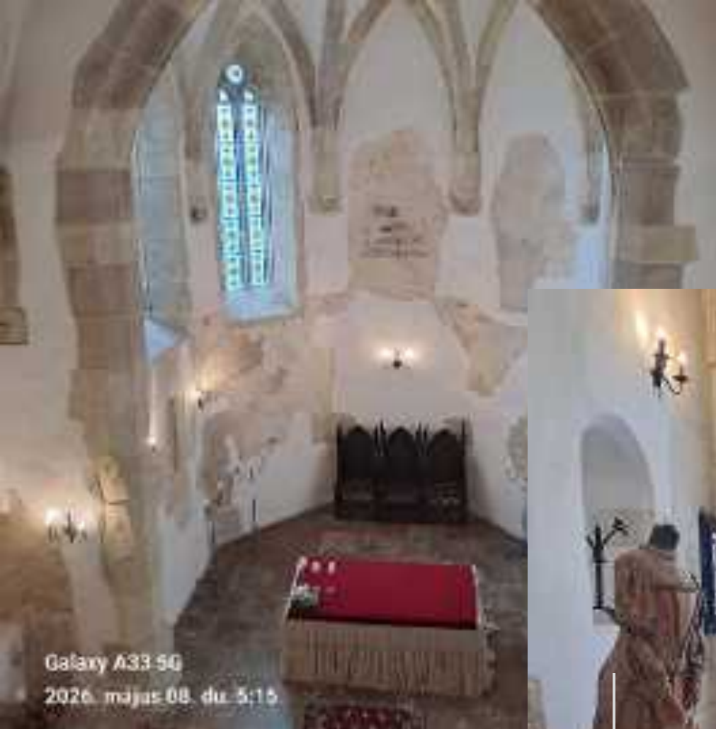
Galaxy A33 5G 2026. mājus 08. di. 5:15