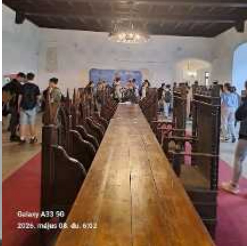
Galaxy A33 5G 2026. mājus 08. di. 6:02