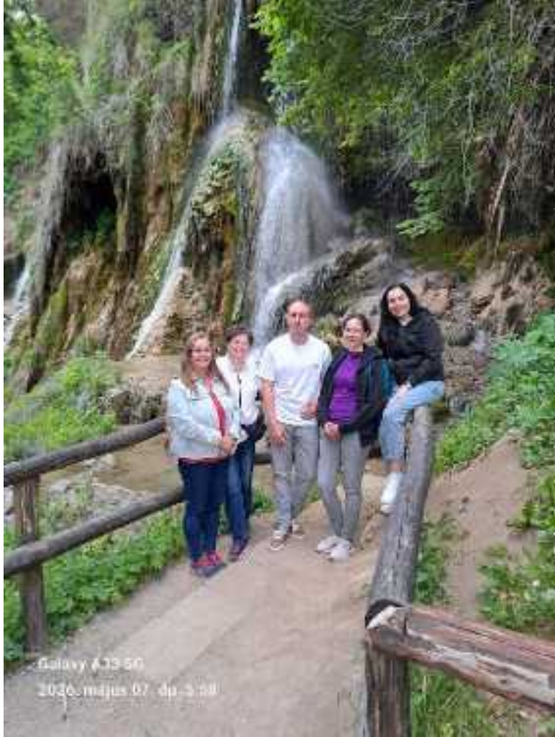
Galaxy A33 5G 2026. május 07. da. 5:58