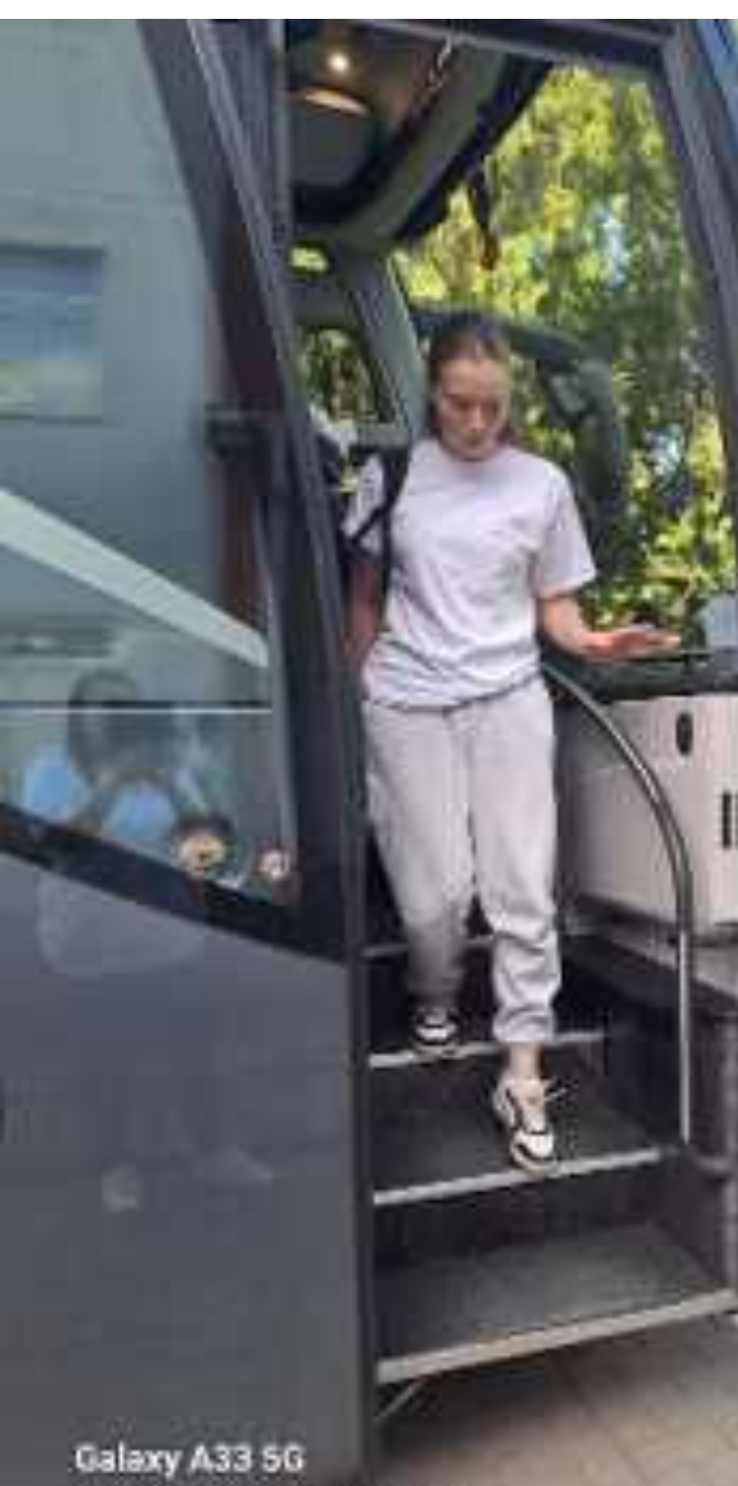
Galaxy A33 5G 2026. mājus 09. dū. 5:36