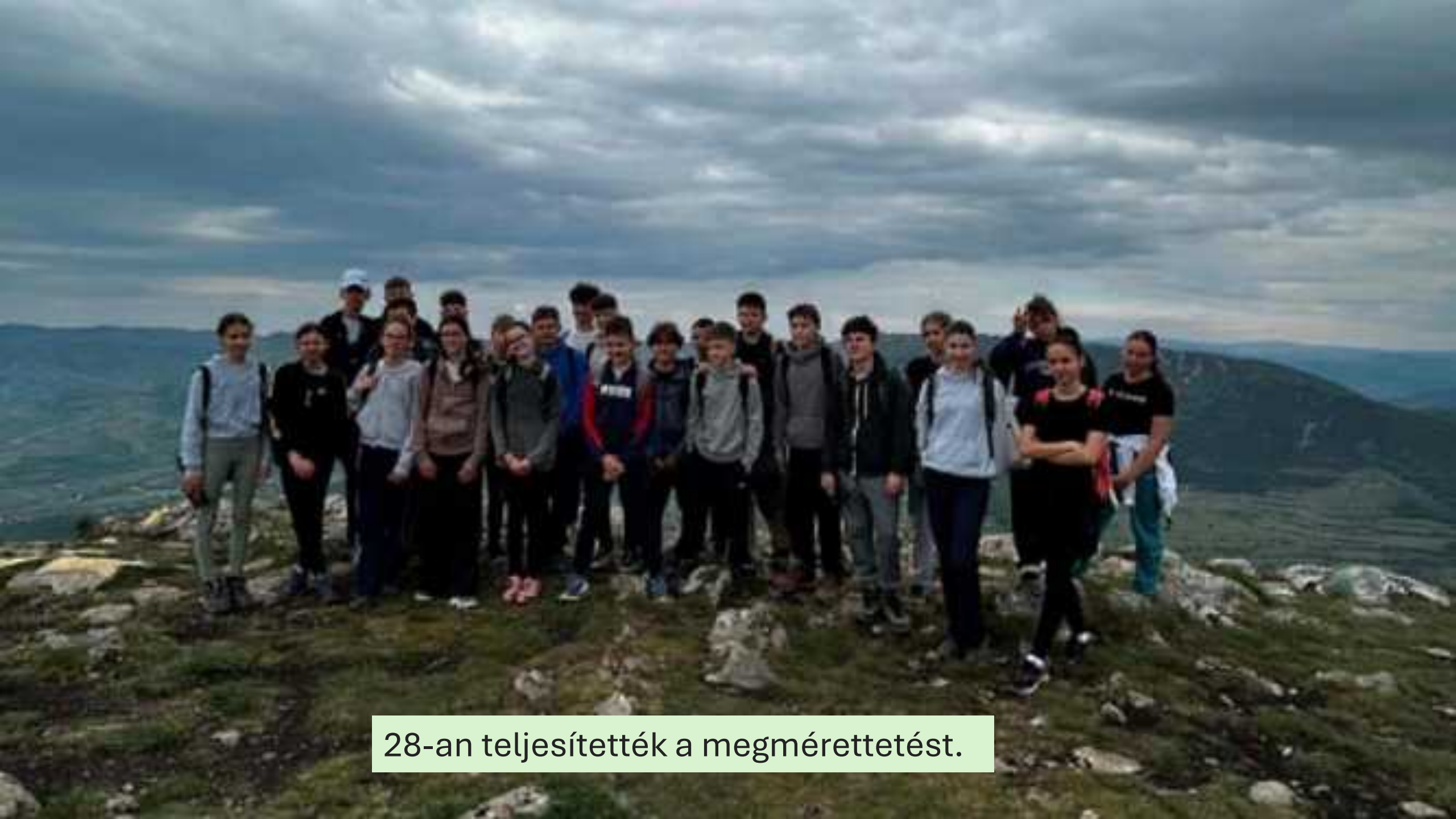
28-an teljesítették a megmérettetést.