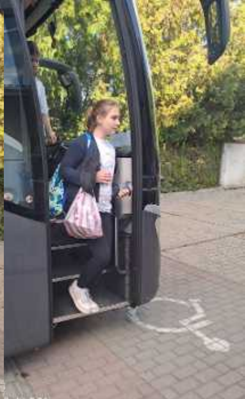
9. dū. 5:36