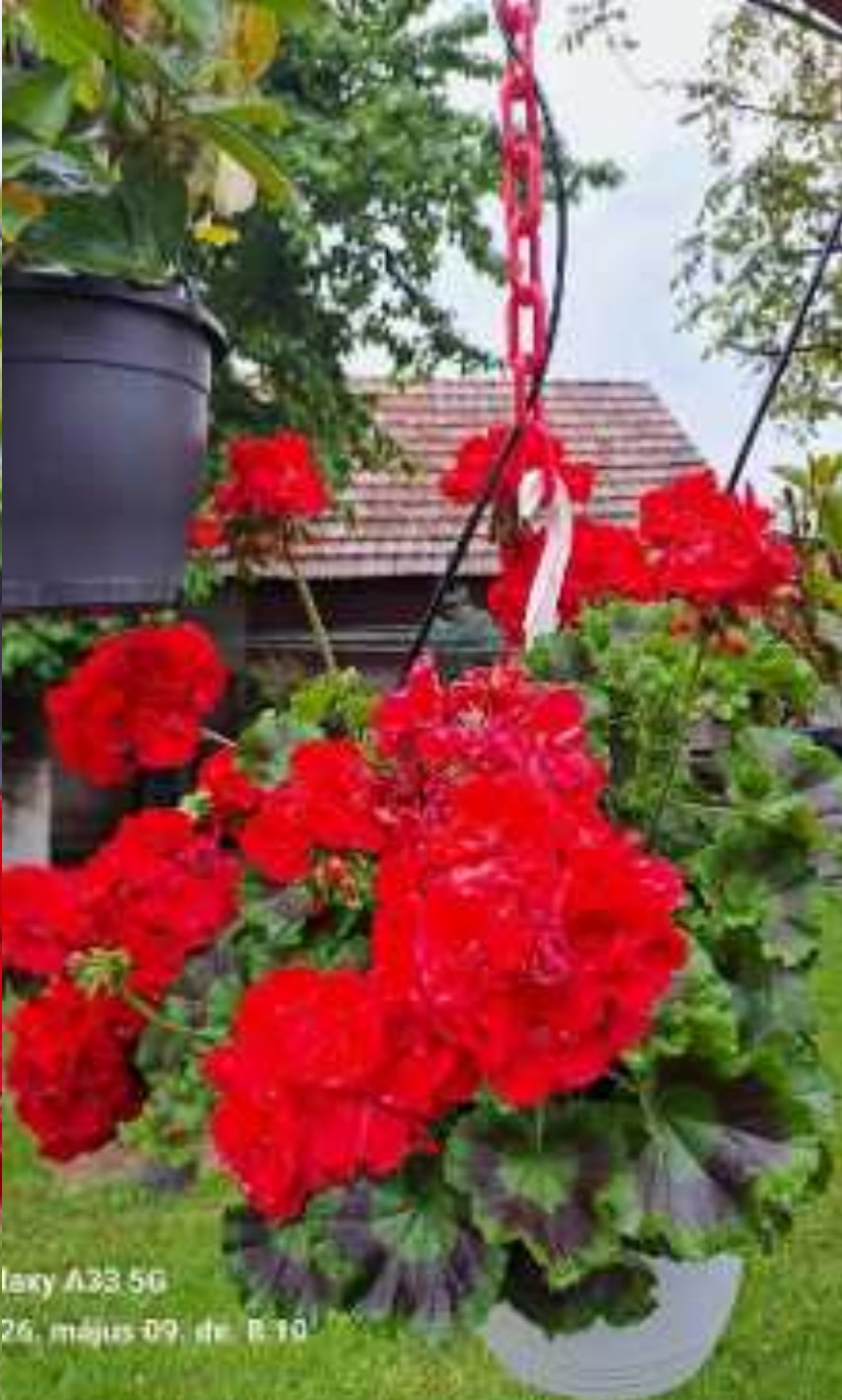
Galaxy A33 5G 2026. május 09. de. 11:10