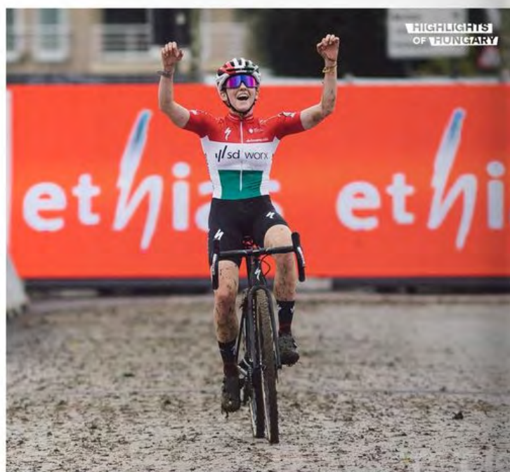
Highlights of Hungary 2021 jelölt vagyok!